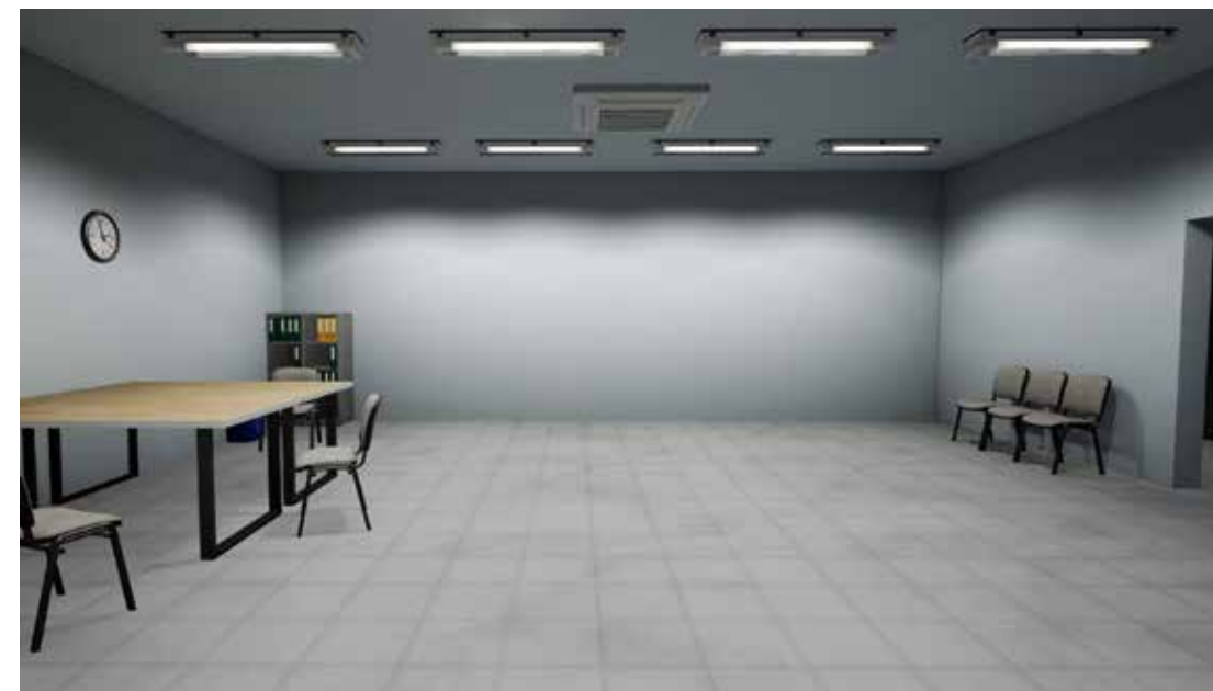
Ilustracja 2. Przykładowa sceneria VR

Środowiska rzeczywistości wirtualnej zazwyczaj charakteryzują się tymi samymi podstawowymi elementami, które obserwujemy w naszym fizycznym otoczeniu: grunt, niebo i inne elementy krajobrazu zewnętrznego, a także podłogi, sufity i ściany przestrzeni wewnętrznych. Zbiór obiektów mogących pojawić się w przestrzeni VR, zarówno realistycznych, jak i fantastycznych, jest w zasadzie ograniczony wyłącznie wyobraźnią projektanta. Ilustracja 2 przedstawia przykładową scenarię VR, w której zgodnie z założeniami badania można umieścić inne obiekty, np. wirtualne reprezentacje ludzi.