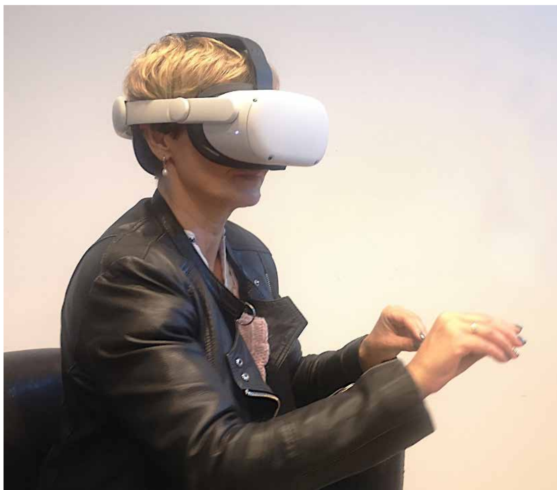
Ilustracja 1. Badanie przy wykorzystaniu urządzenia VR Oculus Quest 2

dokładne odwzorowywanie dłoni i śledzenie wykonywanych przez użytkownika gestów. Z kolei takie systemy, jak Microsoft Kinect pozwalają na wygodne używanie rąk w wirtualnej rzeczywistości (bez konieczności trzymania kontrolerów), wykorzystując sensory zewnętrzne (Cipresso i in., 2018), jednak nie dają możliwości rozpoznawania gestów. Ilustracja 1 przedstawia użytkownika korzystającego z urządzenia VR Oculus Quest 2 podczas badania wykorzystującego m.in. system śledzenia ruchu dłoni.